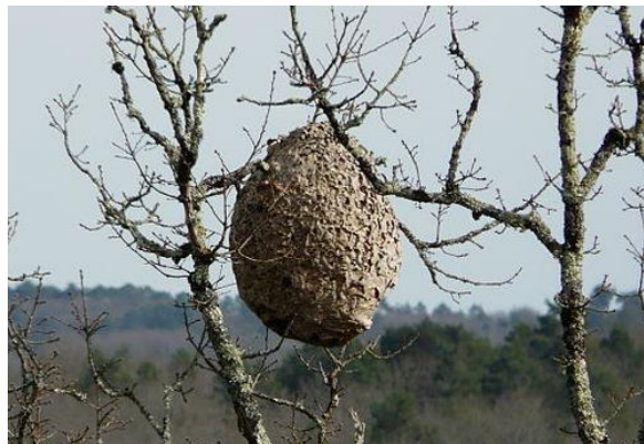
Abbildung 2: Nest in Baumkrone

Bitte melden Sie verdächtige Nester und Insekten (mit Bild und Koordinaten) an: