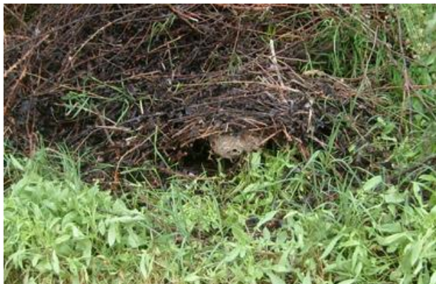
Abbildung 1: Vornest im Frühling http://www.hornissenschutz.ch/vespa-velutina-nth.htm