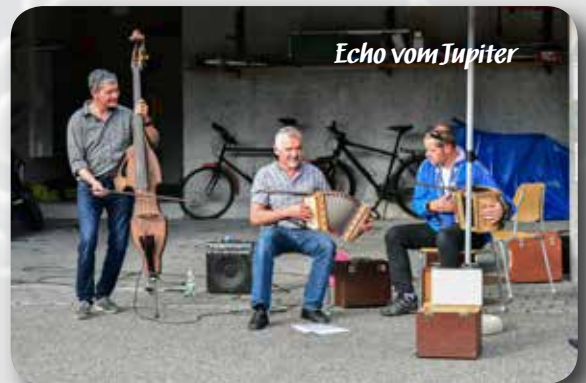
Echo vom Jupiter