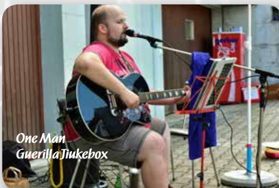
One Man Guerilla Jukebox